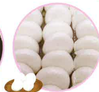
彼岸団子 ◆15個入り 430円