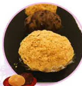
おはぎ ◆1個 120円

お彼岸にはご先祖さまを供養します。 その昔から小豆の赤色には 災難から身を守るといふ言い伝えがあり、 おはぎ、彼岸団子を食べる習慣が 始まったと言われています。